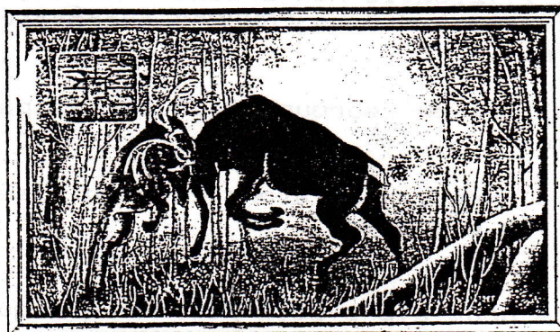
Association Télécartiste du Loiret