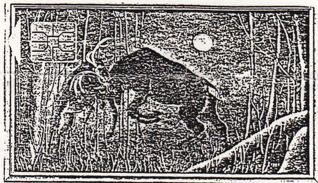
Association Télécartiste du Loiret

LE MINI-JOURNAL DE L'ASSOCIATION TÉLÉCARTISTE DU LOIRET