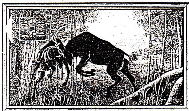
Association Télécartiste du Loiret